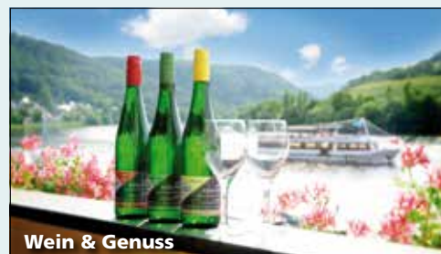
Wein & Genuss

Die Angebote können in Ausnahmefällen Änderungen unterliegen.