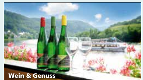
Wein & Genuss

26.08. – 28.08. 2022 23.09. – 25.09. 2022 02.09. – 04.09. 2022 30.09. – 02.10. 2022 09.09. – 11.09. 2022 07.10. – 09.10. 2022 16.09. – 18.09. 2022