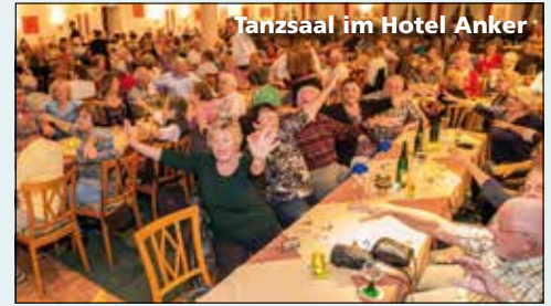
Tanzsaal im Hotel Anker