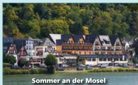
Sommer an der Mosel