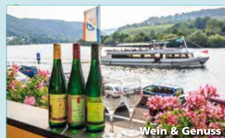
Wein & Genuss