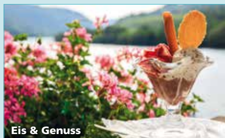
Eis & Genuss