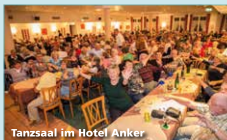
Tanzsaal im Hotel Anker